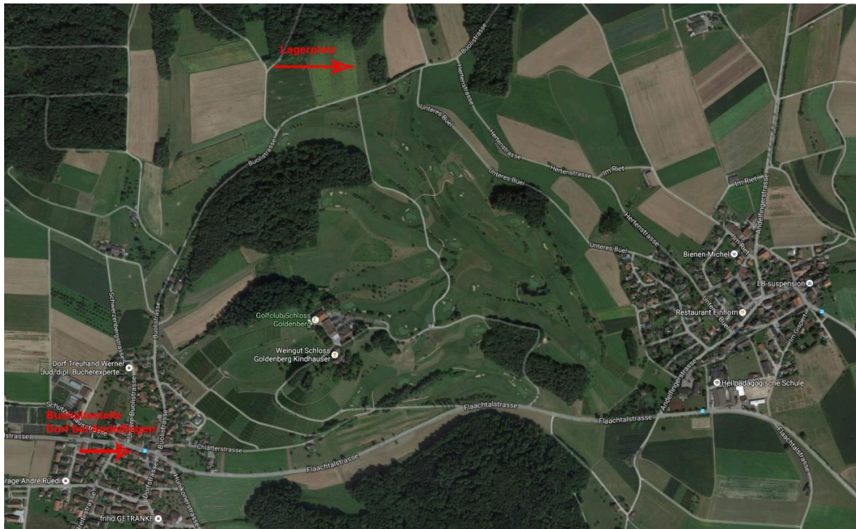
Lageplan Umgebung Dorf/Humlikon

Der Lagerplatz liegt im Zürcher Weinland zwischen Dorf und Humlikon auf 480 m.ü.M. Im Süden liegt der Golfplatz des Golfclubs Schloss Goldenberg, im Norden liegt ein grosser Wald und etwas weiter die Thur. Der Lagerplatz bietet genügend Platz bis max. 300 Personen und erstreckt sich über eine Fläche von 5200 m 2 .